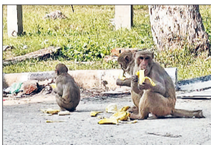
झज्जर। नागरिक अस्पताल परिसर में बंदी बंदरों की टोली से हमेशा बना रहता है खतरा।

शहर में बंदरों के उत्पात से लोगों की रातों की नींद और दिन का चैन गायब हो रहा है। स्थिति यह है कि लोग अब अपने घरों में भी खुद को सुरक्षित नहीं मान रहे हैं। क्योंकि उत्पाती बंदर घर के अंदर घुस कर भी काट रहे हैं। हालांकि यह समस्या पूरे शहर में है, लेकिन वार्ड नंबर 19 में हालात सबसे ज्यादा खराब हैं। पिछले दिनों नगर परिषद द्वारा वार्ड नंबर 19 में स्पेशल टीम बुलाकर बंदर को पकड़ने का आश्वासन दिया था। जिसके चलते बंदर पकड़ने वाली टीम तो पहुंच गई, लेकिन अधिकारियों के साथ तालमेल न बन पाने के कारण टीम वापिस लौट गई। ऐसे में प्रशासन से मायूस होकर वार्ड नंबर 19 के लोगों ने उस उत्पाती बंदर को पकड़ने का स्वयं बीड़ा उठाया है। वार्ड पार्षद